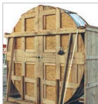
■ Sistema completo de Esteira Porta Cabos acondicionado em bobina para transporte

Os especialistas do nosso Centro de Serviço oferecem a você o suporte necessário.