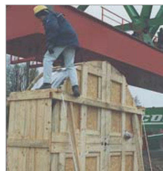
■ Montagem para transporte de sistema completo de Esteira Porta Cabos e cabos