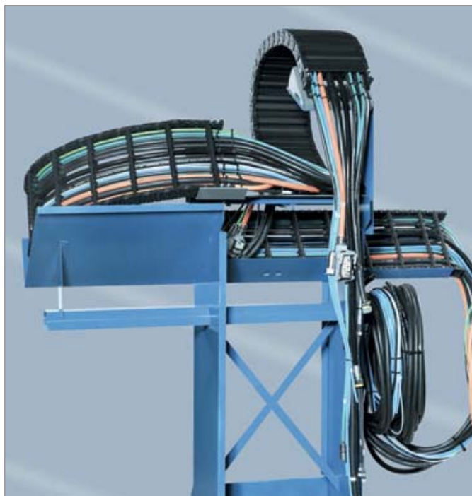
■ Sistema completo com suporte para transporte