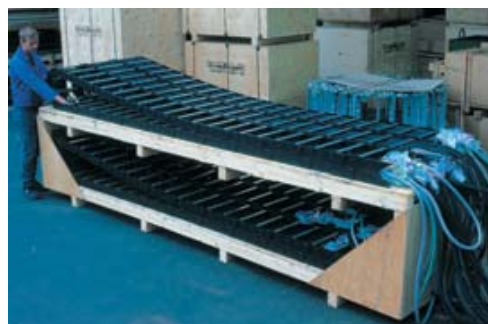
■ Esteiras Porta Cabos em nylon confeccionadas e prontas para instalação.

Nos encarregamos do planejamento e projeto, bem como da aquisição de todos os componentes para seu sistema de Esteiras Porta Cabos